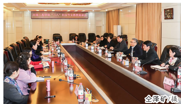
才要实事求是，不能一刀切，要结合实际，量力而行，开动脑筋，尤其是要吸引具有创新创业能力的优秀人才，开创一番天地、有所作为。二是要靠物质条件支撑。要不断优化学校的硬件建设，尤其要解放思想，积极引进社会资源，通过和社会资本的合作，进一步改善办学条件，促进校园发展。三是要靠大学文化支撑，学校要有和谐的气氛，只有校园和谐，大家才能心情舒畅，才有干劲，学校才能发