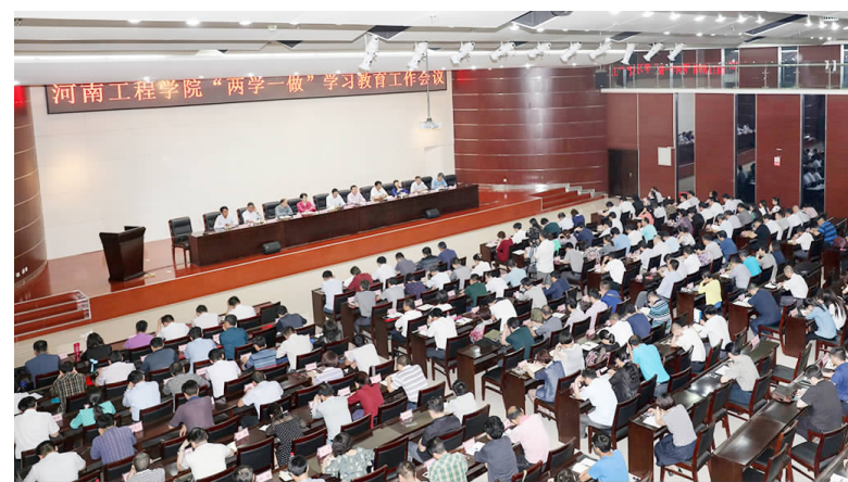
学校召开“两学一做”学习教育工作会议

学一做”的总体要求。一是在目标定位上要把握“四个进一步”。进一步坚定理想信念,提高党性觉悟;进一步增强政治意识、大局意识、核心意识、看齐意识,坚定正确政治方向;进一步树立清风正气,严守政治纪律和政治规矩;进一步强化宗旨观念,勇于担当作为,在生产、工作、学习和日常生活中起先锋模范作用。二是在重点任务上要把握“五个坚持”。着力解决一些党员理想信念模糊动摇的问题,着力解决一些党员宗旨观念淡薄的问题,着力解决一些党员精神不振的问题,着力解决一些党员道德行为不端的问题。三是在组织形式上要把握“五个坚持”。坚持正面教育为主,用科学理论武装头脑;坚持学用结合,知行合一;坚持问题导向,注重实效;坚持领导带头,以上率下;坚持从实际出发,分类指导。四是在工